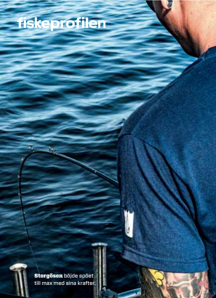
Storgösen började spöet till max med sina krafter.