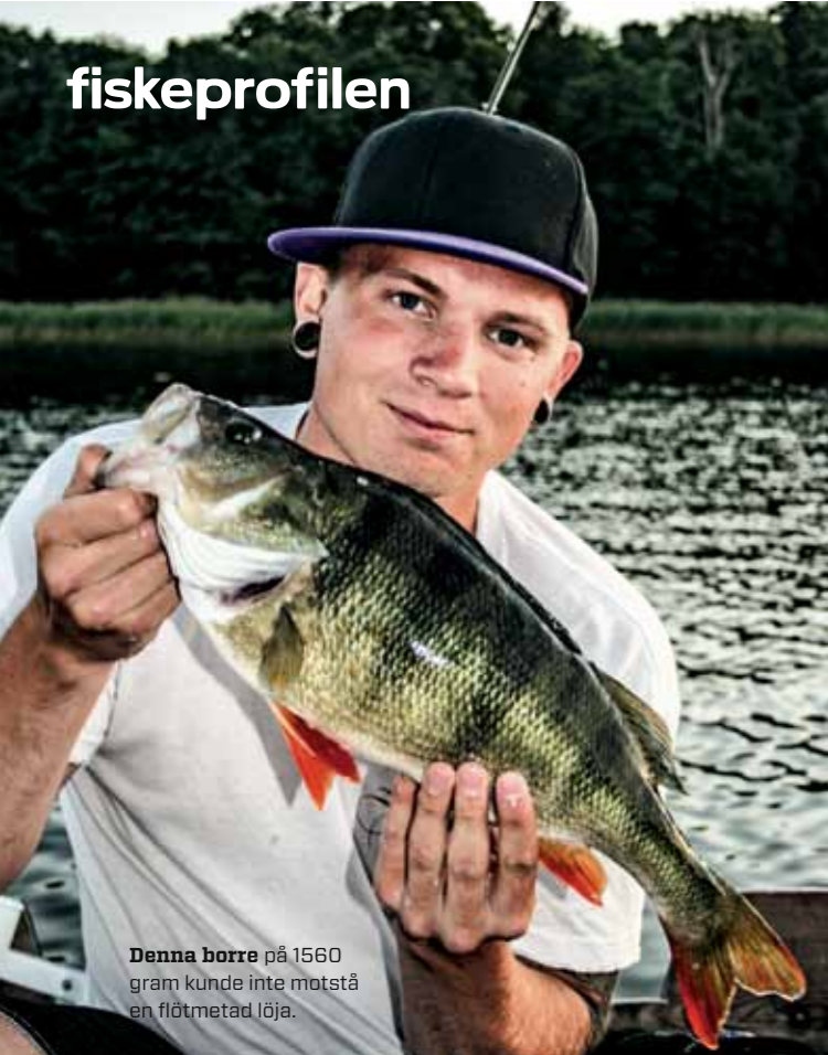
Denna borre på 1560 gram kunde inte motstå en flötmetad löja.

utan den fick snabbt simma ner igen efter en hård kamp mot ett bottenböjt spö. Nu är man i det närmaste helt såld på prickskytte, snacka om beroendeframkallande!