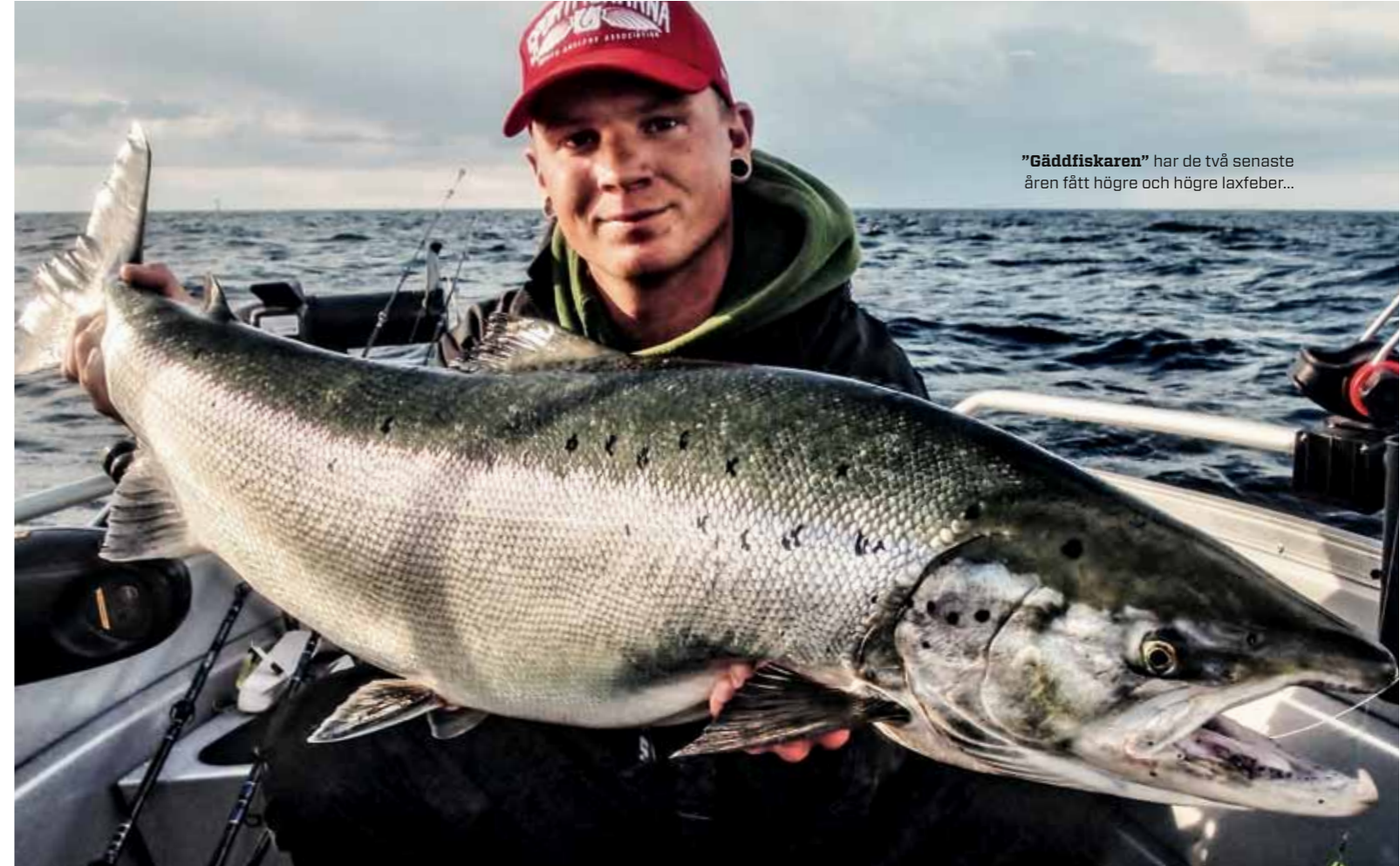
"Gäddfiskaren" har de två senaste åren fått högre och högre laxfeber...

sedan då jag slutade spela ishockey på högre nivå. Jag sa upp mig från mitt jobb i Stockholm och flyttade till Värmland två dagar senare för att plugga på SportfiskeAkademien i Forshaga. Under praktiken var jag bland annat på Sportfiskarna och blev efter det erbjuden en tjänst vilket jag inte var sen att tacka ja till.