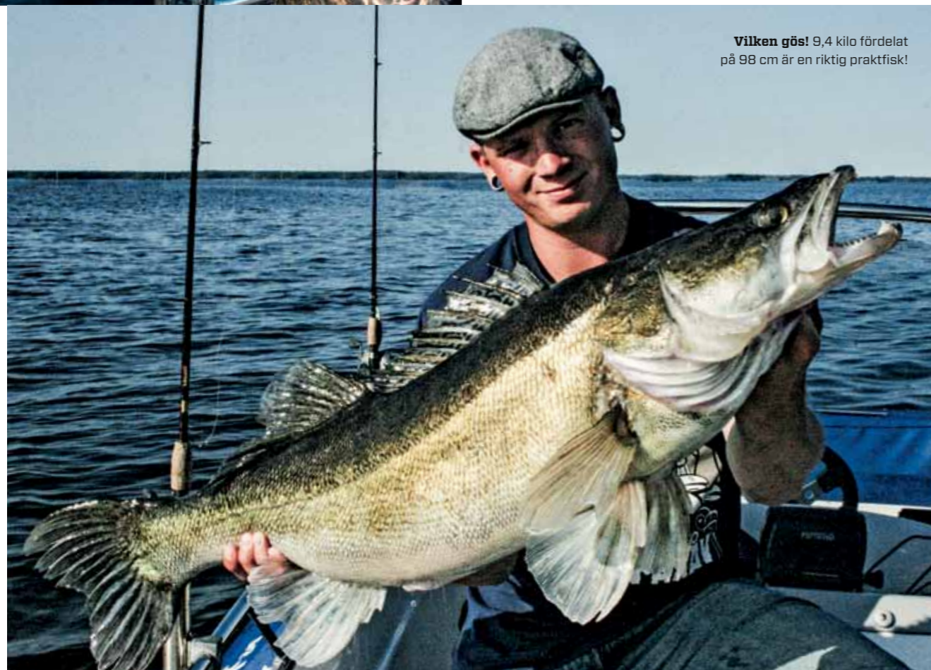
Vilken gös! 9,4 kilo fördelat på 98 cm är en riktig praktfisk!

– Fiskeintresset har alltid funnits där och började väl med mete från någon brygga som för de flesta andra. När de första gäddorna fångades var man väl fast och sedan dess har fiskandet trappats upp successivt med åren för att bli ett mer seriöst utövande för 5–6 år