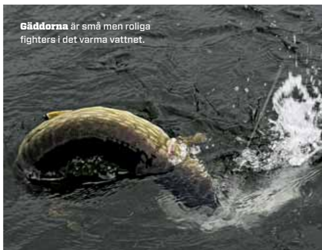
Gäddorna är små men roliga fighters i det varma vattnet.